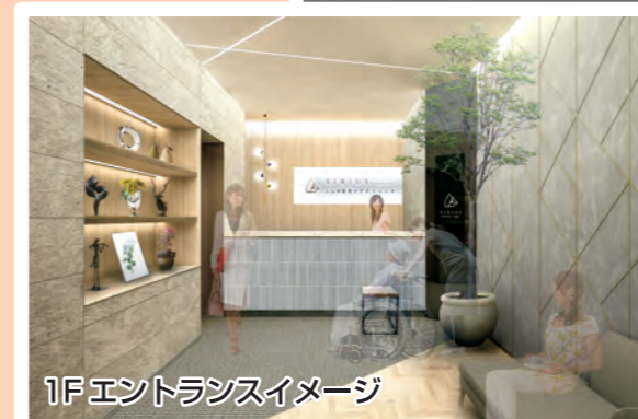
1F エントランスイメージ